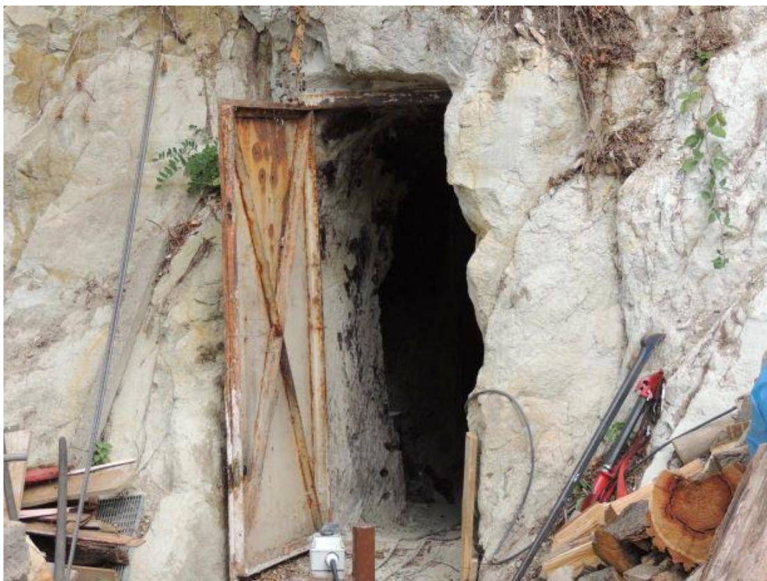
A munkahely bejárata

Egy pince bővítése során 3 fő munkavállalónak az oldalfal vésése, valamint a kibontott anyag felszínre szállítása volt a munkafeladata. A pincébe egy, a hegyoldalon kialakított, a függőleges kőzetfalba épített vasajton keresztül lehetett belépni. A munkavégzési helyre egy ívesen kanyarodó, keskeny folyosón továbbhaladva lehetett bejutni az eredeti, régi pincerészen keresztül. A munkavállalók egy szabályos kör formájú egybefüggő terem alakítottak ki, az ott lévő kőzet bontását végezve és a törmeléket kihordva a föld alól. A faragással létesített terem átmérője kb. 6 méter, legmagasabb pontján kb. 3 méter volt. A munkaterületen beomlás elleni kollektív műszaki védelem nem védte az elektromos vésőgéppel kőzettömböt faragó munkavállalókat. A baleset napján a helyszínrre érkező munkáltató észlelte az omlást, amely maga alá temette a 3 fő munkavállalót.